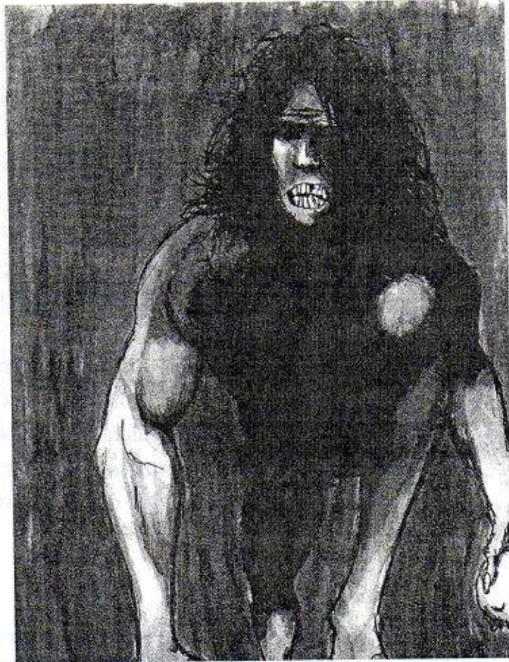
Ilustración del Sinsimito (Augusto Evia)

Otro caso es el que presenta un periodista local, y se trata de un rumor vigente en las comunidades del municipio de Tecoh: un hombre de las cavernas ( sic ), de dos metros de altura, cabello muy largo y cuerpo muy peludo. Deambula durante las noches por las brechas y caminos blancos en los montes del sur del estado, a veces, muy cerca de las comunidades. Quienes lo han visto juran que es espantoso, que más bien parece un gorila o un oso, pero que camina erguido, y conforme avanza deja escuchar un ronco jadeo. Otras personas no lo han visto directamente, pero si han visto sus huellas (López, 2000: 97).